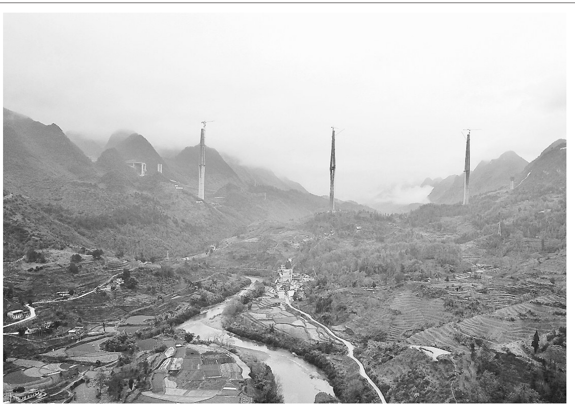
平塘特大桥工程预计2019年底完工

1月7日无人机航拍的平塘特大桥塔架全景,中高332米的世界第一高混凝土塔架。平塘特大桥横跨贵州平塘县通州镇平里河村漕渡河河谷,其中16号塔已于2018年11月成功封顶,成高332米。目前,平塘特大桥工程已进入钢梁安装阶段,预计于2019年底完工。